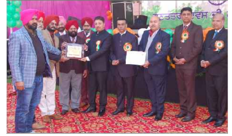
Winner- 220 KV Sub-Station Udoke