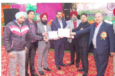
400 KV Sub-Station Rajpura