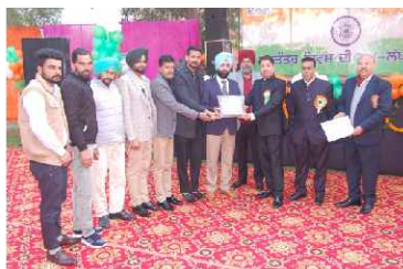
220 KV Sub-Station Dhanaula (Upto 15 years Old)