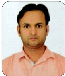
Contributed by: - Munish Kumar AAE/Training Cell