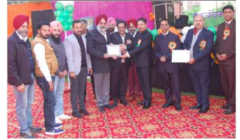
Runner-Up- 220 KV Sub-Station Baja Khana