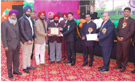
220 KV Wadala Granthian-Verpal LILO at Udoke (More than 15 years old)