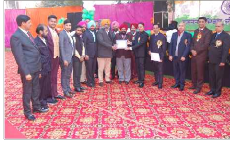
220 KV Majithia-Fathegarh Churian (Upto 15 years Old)