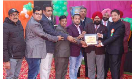
132 KV Kangra-Mamoon