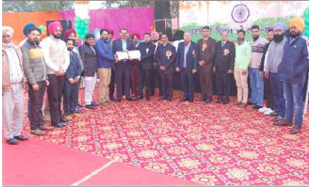
400 KV Rajpura-Bhalwan (Dhuri) Ckt-I