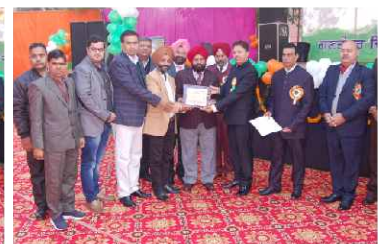
132 KV Sub-Station Mamoon