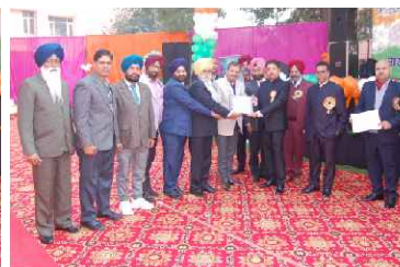
220 KV Sub-Station Ablowal (More than 15 years old)